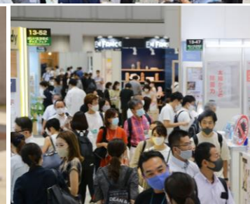
<昨年9月に開催された本展の様子>